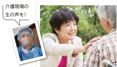
介護現場の生の声を!

三ツ星議員連続受賞(第198回、第201、202、203回)。文藝春秋2020年の論点「注目すべき若手議員七人衆」の1人に選ばれる。厚生労働、消費者、ジェンダー、SOGI、多様性の政策が専門。