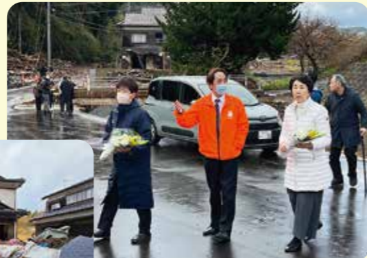
輪島市の豪雨災害の犠牲者に献花