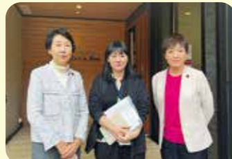
輪島市の社会福祉法人弘和会にて