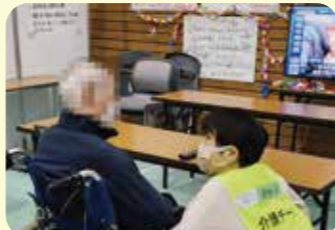
震災直後の介護ボランティア