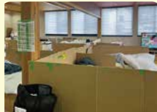
いまも避難される方が2万人超