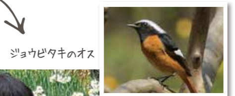
ジョウビタキのオス

ジョウビタキ~冬のアイドル~ 冬になると北からやってくる小鳥、ジョウビタキ。ヒツ、ヒツと鳴き声が聞こえたらこの鳥です。公園や庭先で見かけます。丸々とした姿、鮮やかな色から、冬のアイドルと言われているとか。