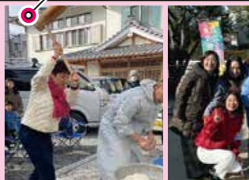
10区総支部の仲間や自治体議員の皆さんと一緒に