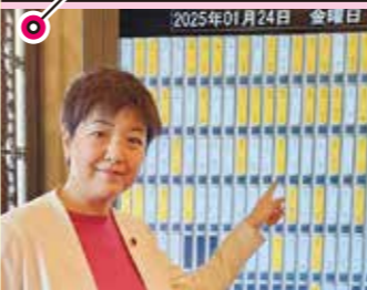
茨木市議選挙、現職、新人で2議席を守りました。