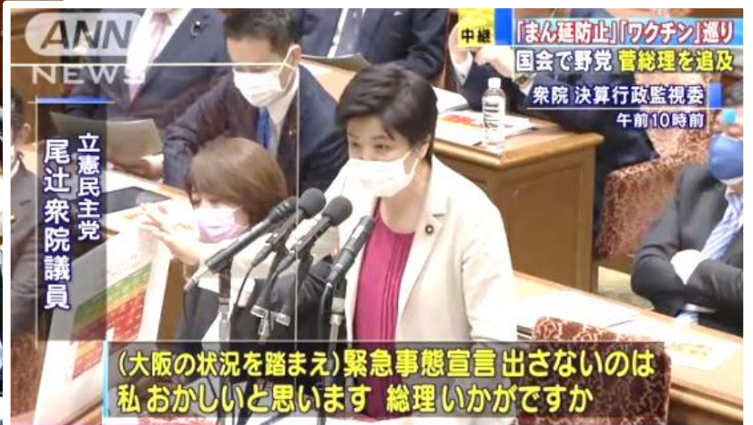
▲菅総理から大阪の現状は「厳しい」という答弁を引き出し、各局ニュースでも取り上げられた