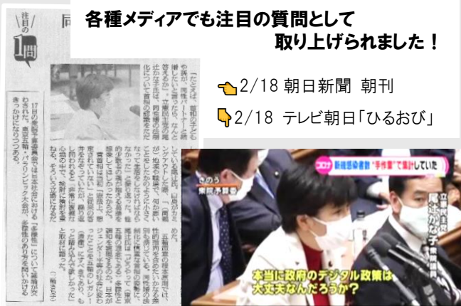
本当に政府のデジタル政策は大丈夫なんだろう？