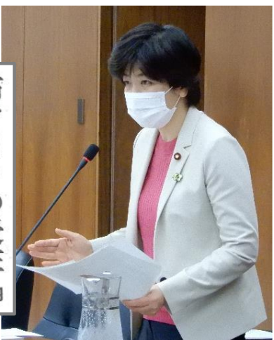
(5月30日朝日新聞より)

布マスクの受注 新たに5社判明 計36億円 新型コロナウイルスの感染拡大防止策として政府が配布している布マスクについて、すでに公表されている6社以外に、新たに5社が受注していることがわかった。いずれも匿名契約。立憲民主党の尾辻かな子衆議院議員の問い合わせに厚生労働省が資料を提出した。新たに受注が判明したのは、ワークス(東京都)▽ブルマール(同)▽東洋織機(大阪府)▽REITER(大阪府)▽ISO International(高松市)で、契約金額は計約36.6億円。介護施設や妊婦向けなど5月12〜15日に契約された。すでに公表されている6社のうち、興和、伊藤忠商事、マツオカコーポレーションに属しない。