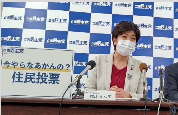
▲市民の命と暮らしを守ることが先決。

6月19日の法定協議会における特別区設置の議案書決定を受けて、立憲民主党大阪府連として大阪市役所で記者会見し、NHKのニュースでも取り上げられました。